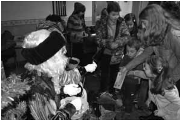
Pajes recogen cartas.

Una vez más, y ya son muchísimas, cumpliendo con una tradición inmemorial, SS. MM. los Reyes Magos de Oriente, acompañados de sus pajes y precedidos por el heraldo, que iba abriendo camino, pasaron de nuevo por nuestro pueblo durante la tarde-noche del día 5 de enero de este año. Y generosos como siempre, cubrieron con holgura la práctica totalidad de las expectativas que los habitantes de Monroyo nos habíamos creado con motivo de su esperada visita. El año anterior (2016), pequeños y mayores intentamos cumplir con nuestras responsabilidades personales y familiares, así como ser respetuosos con las