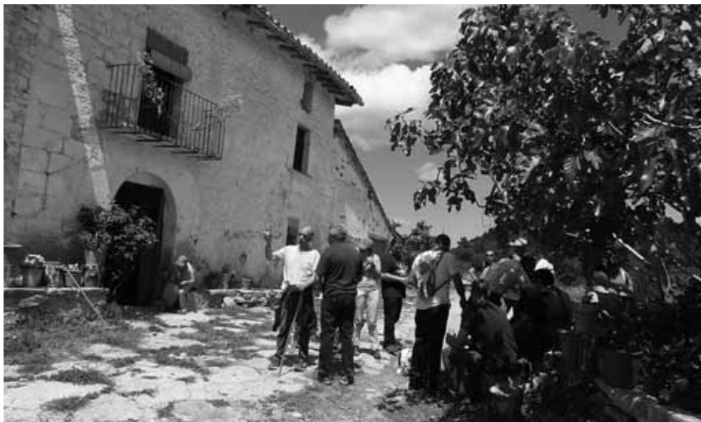
Parada en el mas de Sorolla