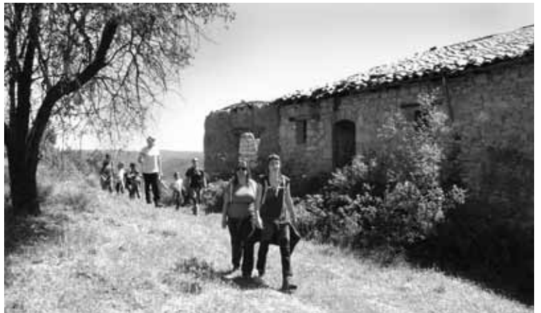
Mas de la Moleta

A continuación, subimos a la Moleta propiamente dicha donde pudimos intuir los restos de un poblado íbero y seguimos hasta el Mas dels Corrals, para continuar hacia el Mas de Sorolla por la misma ruta que previamente habían hecho aquellos que decidieron ir por la ruta más corta, lo cuales tomaron su avituallamiento en dicho mas.