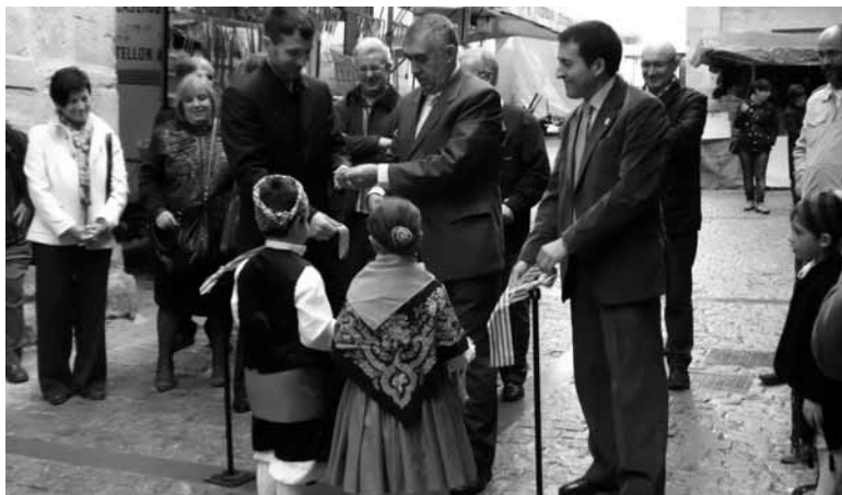
Inauguración de la Feria