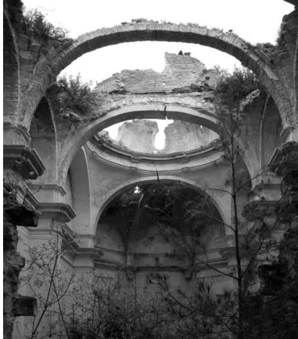
Esquerra: La creu de Ràfels