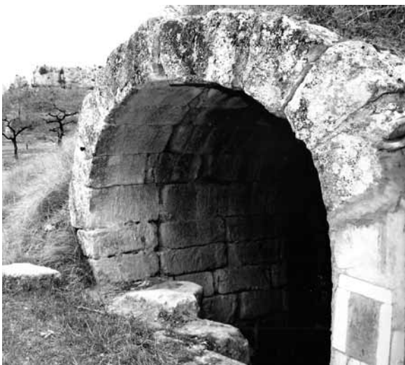
La font d'Alcanyís