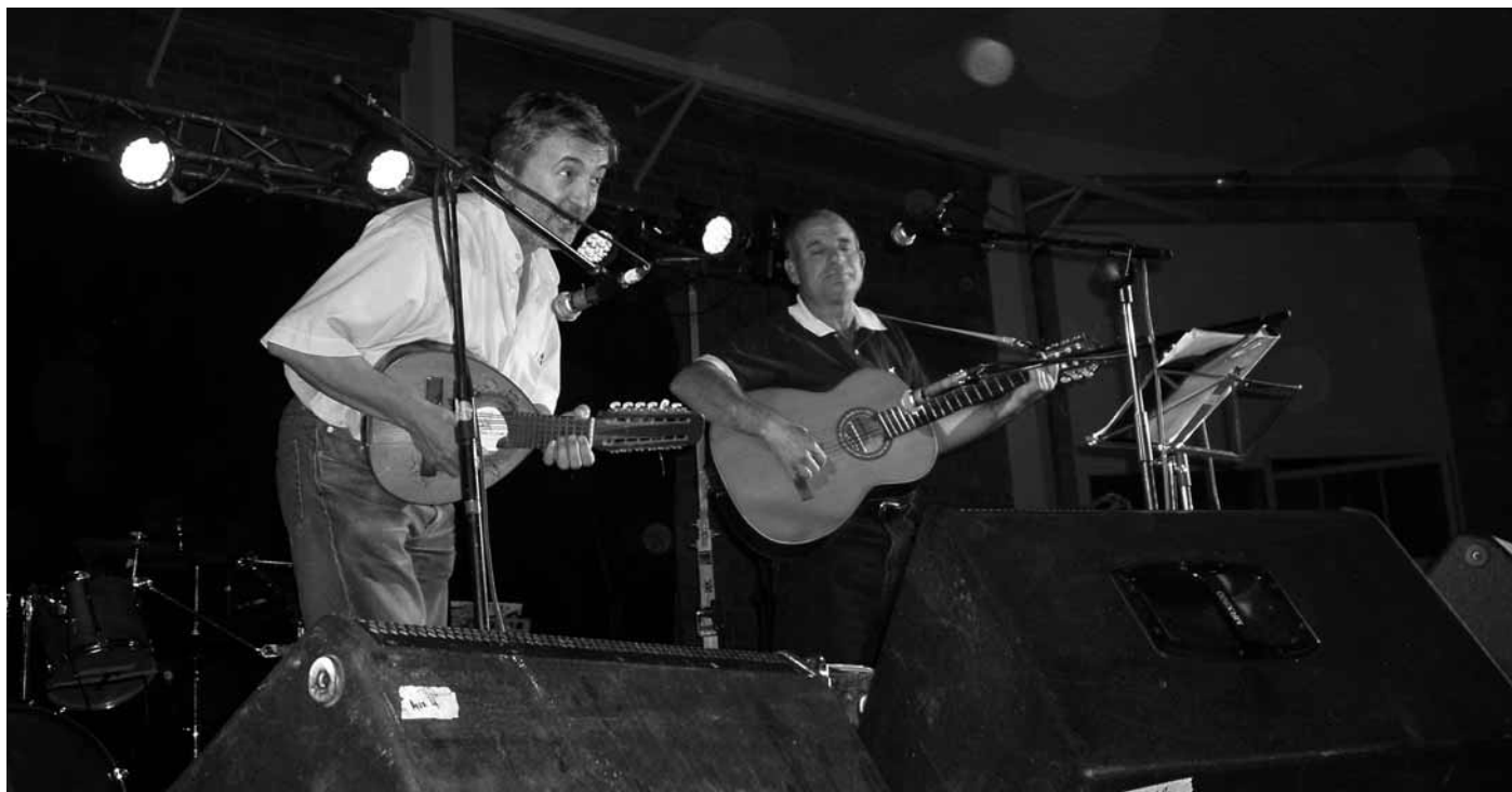
Los Maellans en una actuació