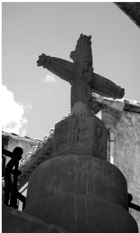
La creu de l'arcada de la Iglésia