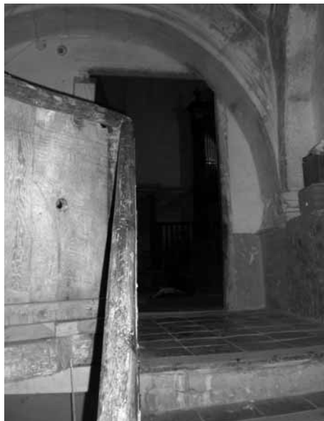
La escalera del coro