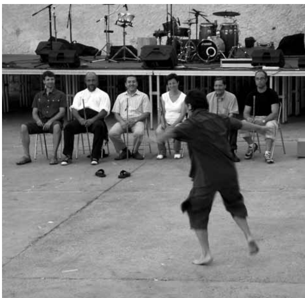
Lo Ball del Poll (Fiestas Mayores 2011)