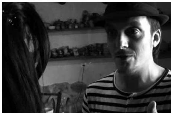
Dos fotogramas del cortometraje

que jamás había experimentado. Sentí en todo momento el calor de la gente, el apoyo, el cariño y sobretodo el reconocimiento de un trabajo bien hecho. En principio estaba previsto un solo pase, pero finalmente realizamos tres y en todos ellos el resultado fue una clamorosa ovación y un sinnúmero de aplausos, que llegaron muy adentro.